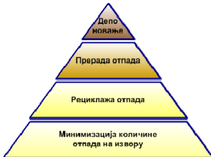
Слика 1.1.1. Циљеви управљања отпадом

Дугорочни циљ израде Локалног плана управљања отпадом је решавање проблема у области заштите животне средине и побољшање квалитета живота становништва осигуравањем жељених услова животне средине и очувањем природе засноване на одрживом управљању животном средином.