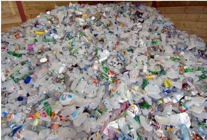
Слика 8.2.1. Амбалажни отпад

У складу са Директивом европског законодавства о амбалажи и амбалажном отпаду бр. 94/62/ЕЦ, регион би морао: