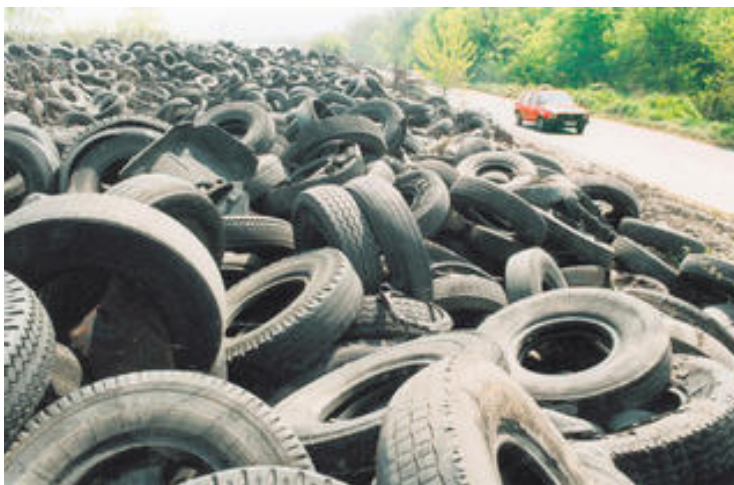
Слика 8.5.1. Отпадне гуме

У вези са Директивом европског законодавства о депоновању отпада, бр. 1999/31/ЕЦ, општина би у складу са захтевима директиве морала да: