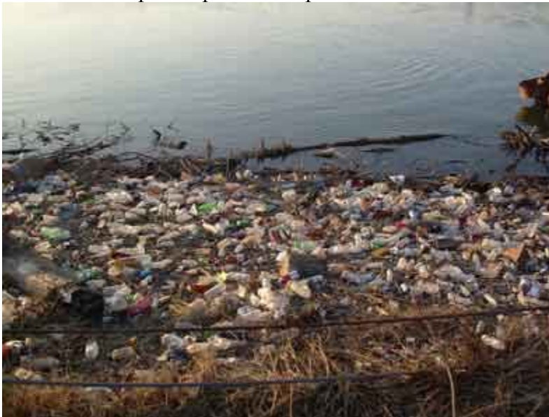
Слика 4.1.1. Непримерено одлагање отпада

приморано да решава проблеме тек када су ескалирали. Пуно времена и новца се губи на сакупљању смећа са “ дивљих сметилишта “, сакупљање отпада расутог поред препуњених судова за смеће, поправкама возила после њиховог преоптерећења и др.