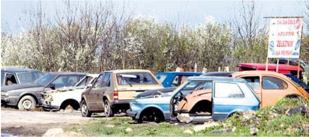
Слика 8.4.1. Ислужена возила

У складу са Директивом европског законодавства о ислуженим возилима бр. 2000/53/ЕЦ, дати су следећи предлози :