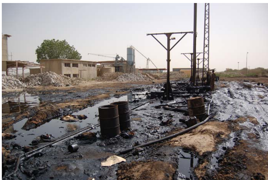
Слика 7.1. Индустријски отпад

Подаци о генераторима се добијају искључиво на самопријављивању, тј. на доброј вољи, мада закон прописује ту обавезу, а у складу са Правилником о начину поступања са отпацама који имају својства опасних материја (“Сл. Гласник РС”, бр. 12/95). Један број генератора редовно доставља податке о количинама генерисаног отпада надлежној еколошкој инспекцији, али укупан број генератора и количина отпада у Србији, нису познати.