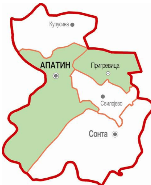
Слика 5.2.1: Територија одношења отпада