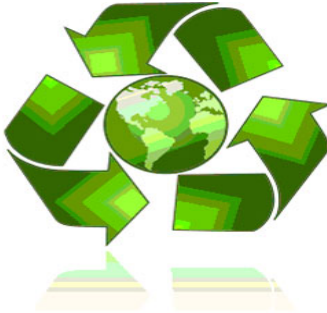
Слика 13.1. Међународни симбол за рециклажу