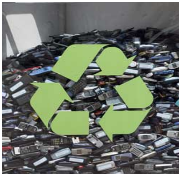
Слика 4.5.1. Обновљање отпада

Сепарација, рециклирање и поновно коришћење комуналног отпада може да има велики утицај на економију земље у развоју. Корисне материје могу се продавати предузимачима за рециклажу. Комплетна активност везано за рециклажу, укључујући транспорт, захтева радну снагу. Економски статус људи који се запошљавају се тако побољшава.