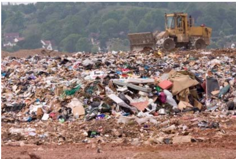
Слика 4.6.1. Градска депонија

Процес биодеградације одређених компоненти комуналног отпада може почети и пре него што је отпад прикупљен и трајати током транспорта. Биодеградација се даље поспешује нпр. мокрим дробљењем. У неким земљама је забрањено додавање течности ради убрзавања процеса биодеградације зато што су више забринуте са повећаним количинама процедурних вода које се тада стварају. Када се отпад нађе на депонији, брзина деградације ће се рапидно повећавати, нарочито у присуству влаге. Међутим, када се густина отпада повећава, да би се олакшао транспорт, отежава се продирање влаге у масу отпада па се и почетак биодеградације одлаже. Почетно, деградација је аеробна, а као споредни производи се стварају водоник и угљен-диоксид. Како кисеоник струји навише кроз масу отпада, долази до стварања анаеробних услова и споредни производи постају метан и угљен-моноксид. С обзиром да је метан запаљив и да у затвореном простору може бити експлозиван потребно је спровести специјалне мере вентилације депоније. На локацијама где је производња гаса значајна уводи се пракса искоришћавања гаса. Могуће је добити корисне количине гаса за период од неколико десетина година.