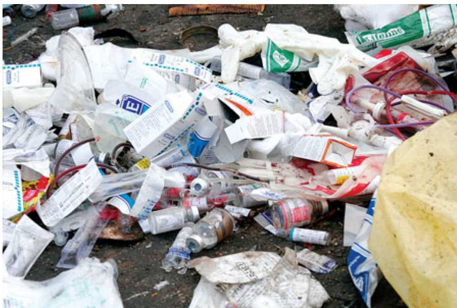
Слика 7.5.1. Неадекватно управљање медицинским отпадом

Као и за већину других врста отпада, у Србији постоји врло ограничен број поузданих података о настајању медицинског отпада, било да се ради о биохазардном медицинском отпаду или о укупном отпаду из здравствених установа. Треба истаћи да углавном нема раздвајања отпада на извору, као и да се медицински отпад депонује уз остали комунални отпад на депонији-сметлишту. Нема посебних мера предострожности или процедура за руковање, транспорт или одлагање отпада из медицинских или сличних објеката.