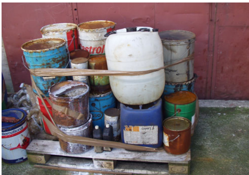
Слика 7.4.1. Опасан отпад

Класификовани и на прописан начин обележени опасни отпаци из привремених складишта, одлажу се на посебно уређени простор, складиште.